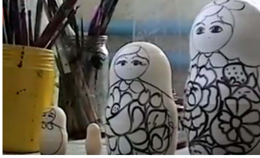
صورة رقم (١٠) زخارف الدمية

بعد ذلك تلون الدمية باستخدام فرش يدوية بمهارة ودقة وتناسق ن كما في الصورة رقم (١١) ، ثم تكرر التلوين لباقي الدمى .