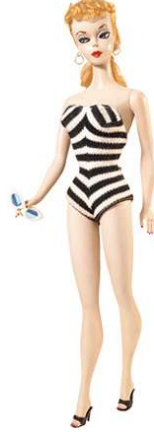
صورة رقم (١٣) التصميم الاول

قادر فريق البيتلز Beatles غزوا موسيقيا بريطانيا واكبته باربي من خلال اصدارة قابلة لثنى الجذع تستطيع اداء رقصات مع ابن عمها ستاسى Stacey الناطق بلهجة انجليزية مرحة . كما اصدارة لباربي تحاكي تصفيفة شعر السيدة كنيدي وترتدى زى وزارة الدفاع الامريكية متعدد الالوان