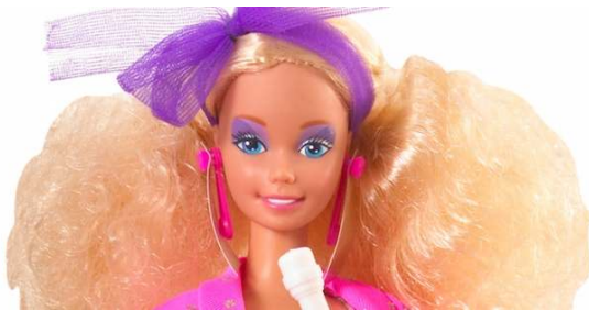
صورة رقم ( ١٨ ) وجه باربي الثمانينيات

وقد احتلت باربي ولاول مره لوحات اعلانية كبيرة على الطرق السريعة تظهر في اطلالة ملائكية .