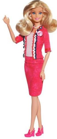
صورة رقم ( ١٩ ) اصدار باربى كمرشحة للرئاسة

فى عام ١٩٩٢ والذى عرف بعام المرأة فى السياسة تم انتخاب ٢٤ امرأة لعضوية مجلس النواب وعلى اثر ذلك تم اصدار نموذج باربى كمرشحة رئاسية كما فى الصورة رقم (١٩) مما تبع ذلك تعديلات تصميمية حيث زاد ارتفاع الدمية ليصل الى ١٠ بوصة اى ما يقرب من ٢٥ سم لتصبح الاكثر طولاً من اى وقت مضى كما تم تعديل فى الثياب باضافة وسائد للاكتاف لتبدو اكثر عرض.