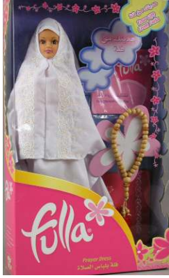
صورة رقم (٢١) فلة