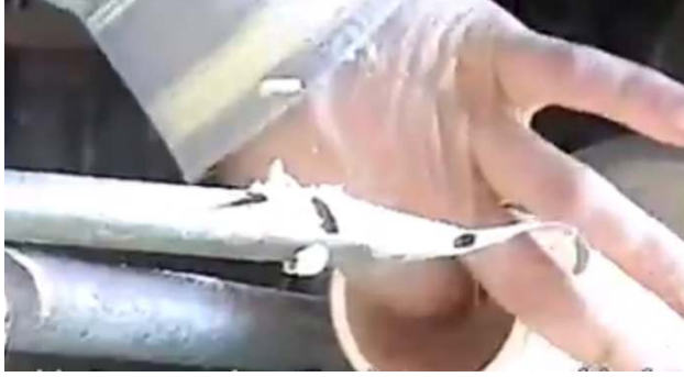
صورة رقم (٦) تفريغ أجزاء الدمية

يتم تفريغ أجزاء الدمية كما هو موضح بالصورة رقم (٦) باستخدام أزميل مخصص لهذا الغرض مع الحذر حتى لا تتلف الحواف الخارجية والتي سيتم من خلالها تجميع أجزاء الدمى .