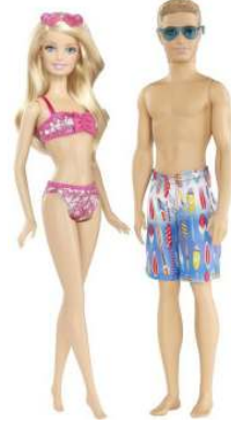
صورة رقم (٢٠) باربي وكين

في ٢٠٠٩ احتلّت باربي من خلال اسبوع الموضه برعاية مرسيدس بنز بالذكرى الخمسين بمنزلها حلم مالمبو .