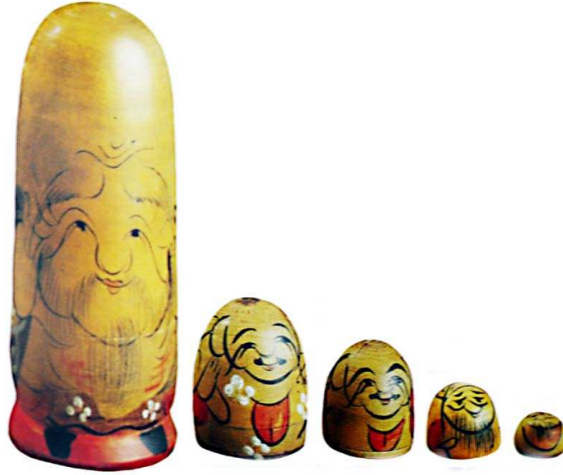
صورة رقم (1) فوكاورما Fuk uruma - دمية يابانية

وفى أحد إجتماعات يوم السبت التقليدية التى يعقدها مامونتوف جلب أحدهم دمية يابانية تدعى فوكاورما Fuk uruma وهى مكونة من سبع نماذج متداخلة لرجل مسن ، وعلى الجانب الاخر يقال ان النموذج الاول من الدمية المتداخلة منشأه جزيرة هونشو Honshu اليابانية وقد ابتكرها راهب روسى كما هو موضح بالصورة رقم (1).