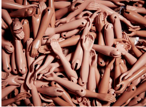
صورة رقم (٢٥) أذرع دمي باربي

تستخدم القوالب الدوارة للحصول على منتجات سواء مفرغة أو مصمته لكافة الحجم المتاح وحتى أكثرها دقة وأقلها سمكاً، ومواكبةً للتطور التقني في الخامات لتحقيق نتائج أفضل؛ فقد إتجهت شركة ماتيل إلى تصنيع أذرع دمي باربي من مركب خلات فاينيل- إيثيلين Ethylene-vinyl acetate ويعرف اختصاراً EVA والذي يتم تركيبه من الايثيلين والفينيل الحمضي كما في الصورة رقم ( ٢٥ ) .