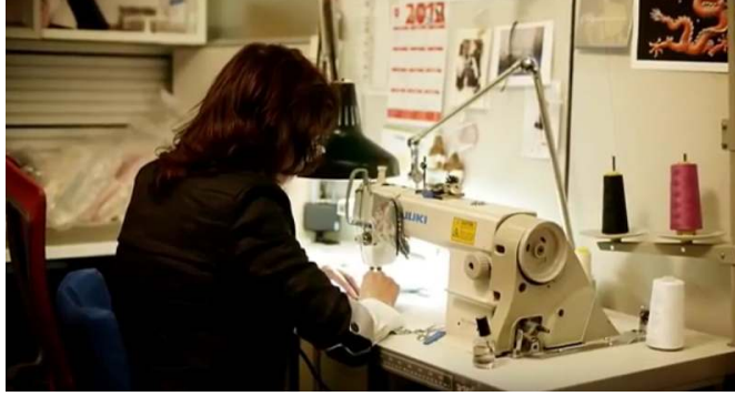
صورة رقم (٣١) حياكة الاقمشة

يتم حياكة الاقمشة لتنفيذ الرداء بواسطة ماكينات الخياطة كما هي موضحة بالصورة رقم (٣١).