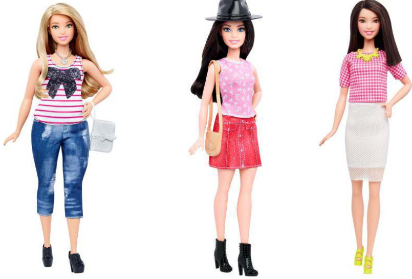
صورة رقم (٢٣) تصميمات حديثة لباربي