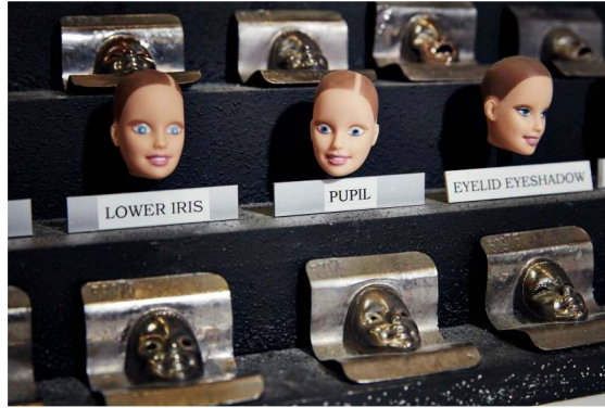
صورة رقم (٢٧) أقنعة لطلاء الاعين

ولكى تبدو عيون الدمي بذلك المظهر المميز فقد ابتكرت الشركة طريقة تعتمد على أقنعة معدنية للوجه مفرغ فيها فتحات للعين كما فى الصورة رقم (٢٧) لرش مخضب ذو قاعدة مائية مطورة