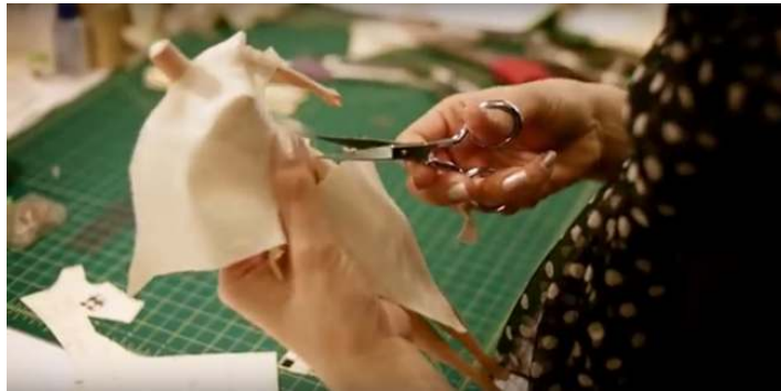
صورة رقم (٣٠) قص القماش

ثم يتم عمل باترونات واختيار الأقمشة أو الخامات المستخدمة استعداداً لحياكتها كما في الصورة رقم (٣٠) .