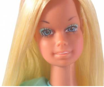
صورة رقم ( ١٦ ) وجه باربي السبعينيات