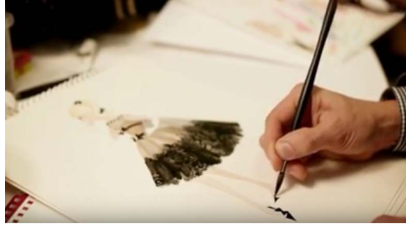
صورة رقم (٢٩) تصميم الأزياء

على التوازي يقوم فرق عمل آخر بتصميم وتنفيذ ملابس والدمية فيقوم أولاً مصمم أزياء بوضع خطوط التصميم كما في الصورة رقم (٢٩) .