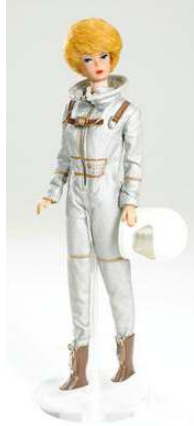
صورة رقم (١٤)