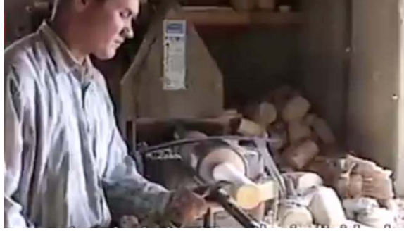
صورة رقم (٥) خراطة أجزاء الدمية

يتم تفريغ أجزاء الدمية كما هو موضح بالصورة رقم (٦) باستخدام أزميل مخصص لهذا الغرض مع الحذر حتى لا تتلف الحواف الخارجية والتي سيتم من خلالها تجميع أجزاء الدمى .