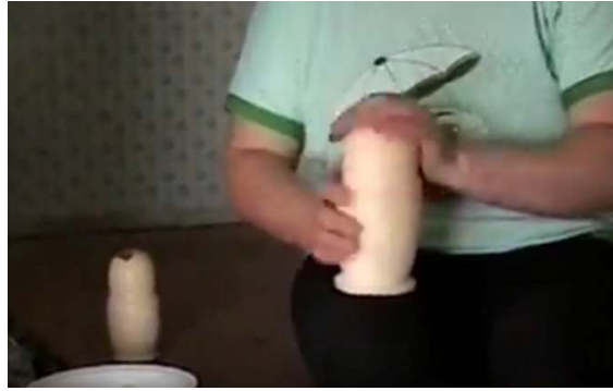
صورة رقم ( ٩ ) معالجة السطح بزيت بذرة الكتان

بعد التأكد من الإنسيابية والنعومة تزال الدمية من المخرطة ، ومن ثم تعاد الاجراءات السابقة مرات ومرات حتى يحصل على عدد الدمى المطلوبة والتي عادة ما تتراوح بين ثلاثة إلى خمسين دمية ، بعدها يتم معالجة السطح الخارجى للدمى بزيت بذرة الكتان كما هو موضح بالصورة رقم ( ٩ ) ، وفى العادة تتم يدويا بدون استخدام أدوات .